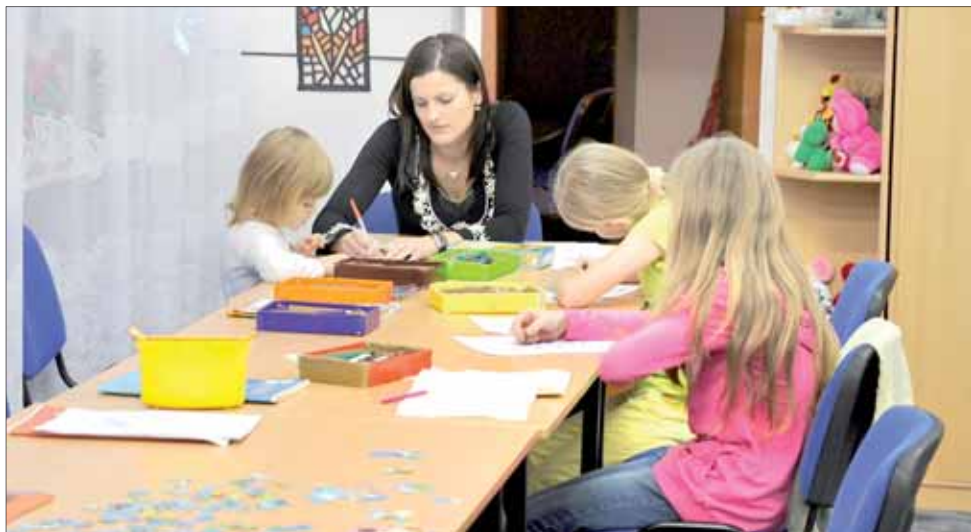
Popołudniami w świetlicy środowiskowej dziećmi opiekuje się stażystka

Klub Integracji Społecznej w Janowie Lubelskim pomaga osobom długotrwale bezrobotnym wyrwać się z zakłętą kręgą bierności i bezrobocia. Uczy ich nowych umiejętności i wiary w możliwość zmiany swego losu. Dzięki niemu bezrobotne kobiety zajęły się opieką nad starszymi ludźmi, a mężczyźni sami wyremontowali dla siebie mieszkania socjalne.